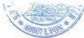
Photo n° 18