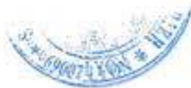
Photo n° 14