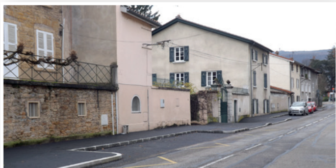
Rue Henri Bouchard

Le projet prévoit un trottoir répondant aux normes des deux côtés de la rue, deux plateaux surélevés aux carrefours rue du musée / gros platane, deux alternats en début et fin de rue, des passages protégés, un allongement du plateau « chemin de l'épine » et des bordures de trottoirs dissuasives pour éviter le stationnement de véhicules sur le cheminement piétonnier.