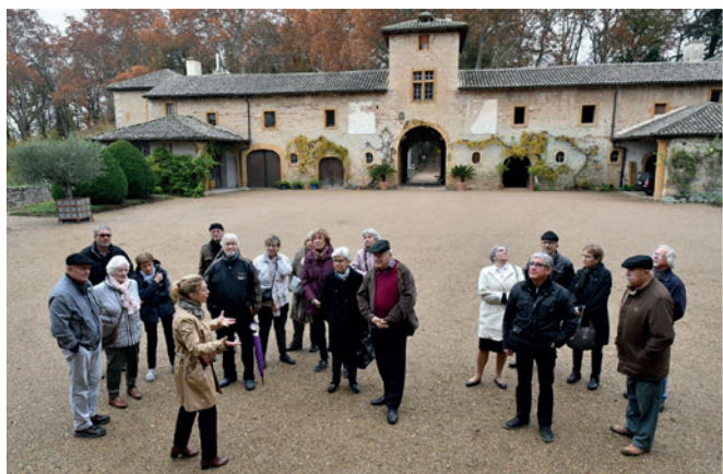
Le château de Fléchères à Fareins

Attendus par nos guides à 10h30, nous fûmes répartis en deux groupes pour la visite très intéressante et documentée.